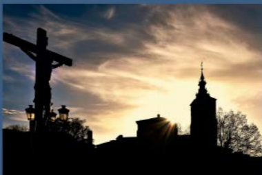
2º Premio: Título: "Tinieblas" Autor: Antonio de Antonio García