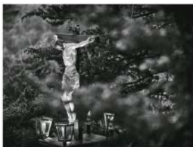
Mejor Colección Título: "PASIÓN BLANCO Y NEGRO I, II, III, IV" Autor: Daniel Sanz Sierra