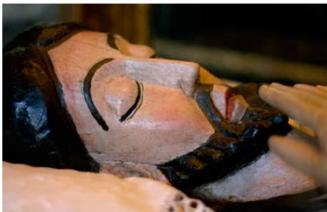
"Cristo de los Gascones"