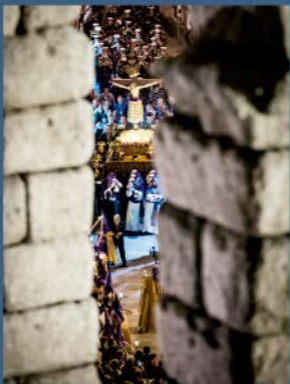
1º Premio: Título: "Entre Arcos" Autor: Óscar Costa Santiuste